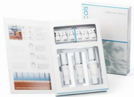
Pacchetto Trattamenti Opulence

Il Pacchetto Trattamenti – che include i Prodotti di Supporto da utilizzare a casa essenziali per la stratificazione dello ialuronico – include una serie di sei Intraceuticals Opulence Infusions® da eseguire una volta alla settimana. Dopo sei settimane la pelle sarà ed apparirà più liscia, le linee sottili e le rughe risulteranno più rilassate e la pelle risplenderà con rinnovata radiosità e luminosità. In seguito, per mantenere i cambiamenti positivi le applicazioni potranno essere ripetute ogni 2/4 settimane.